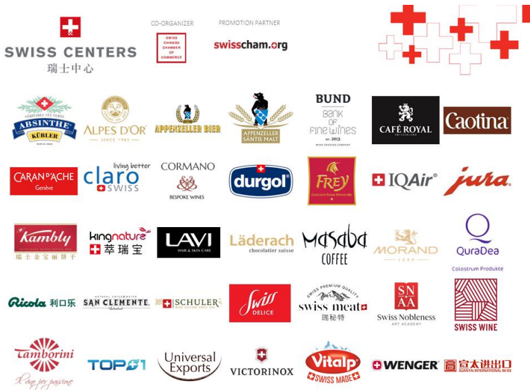
Bildunterschrift: Mehr als 25 Schweizer Marken werden an der CIIE 2021 ihre Qualitätsprodukte vorstellen.