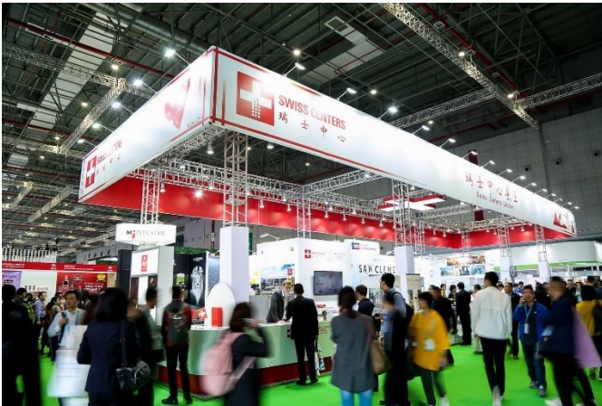
Bildunterschrift: Eine Kostprobe der Schweiz in China: Swiss Centers organisiert einen Schweizer Gemeinschaftsstand an der China International Import Exhibition 2021. Im Foto ist der Stand 2019.

Die CIIE, die weltweit erste auf Import spezialisierte Messe, wird «weiterhin eine Mega-Show für die neuesten Produkte, Technologien und Services aus aller Welt sein», sagten die Organisatoren in einer kürzlichen Pressekonferenz. Wie schon in bisherigen Auflagen, setzt sich die Messe auch 2021 zum Ziel, Geschäfte und Kooperationsabkommen zwischen teilnehmenden Firmen und Einkäufern einzufädeln und abzuschliessen.