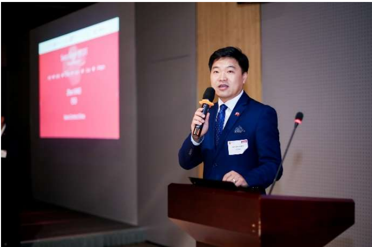
Légende: XIAO Zhen, PDG du Groupe Swiss Centers